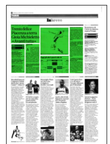
Superficie 34 %