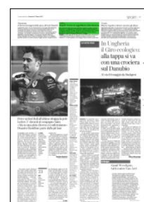
Superficie 2 %

ARTICOLO NON CEDIBILE AD ALTRI AD USO ESCLUSIVO DEL CLIENTE CHE LO RICEVE - 4