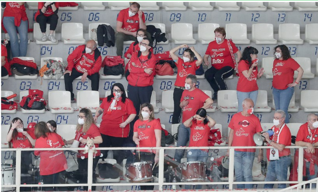
Uno scorcio della tribuna del PalaTrento con i Lupi Biancorossi