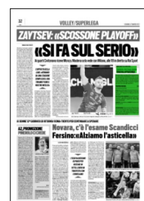
Superficie 5 %

ARTICOLO NON CEDIBILE AD ALTRI AD USO ESCLUSIVO DEL CLIENTE CHE LO RICEVE - 4